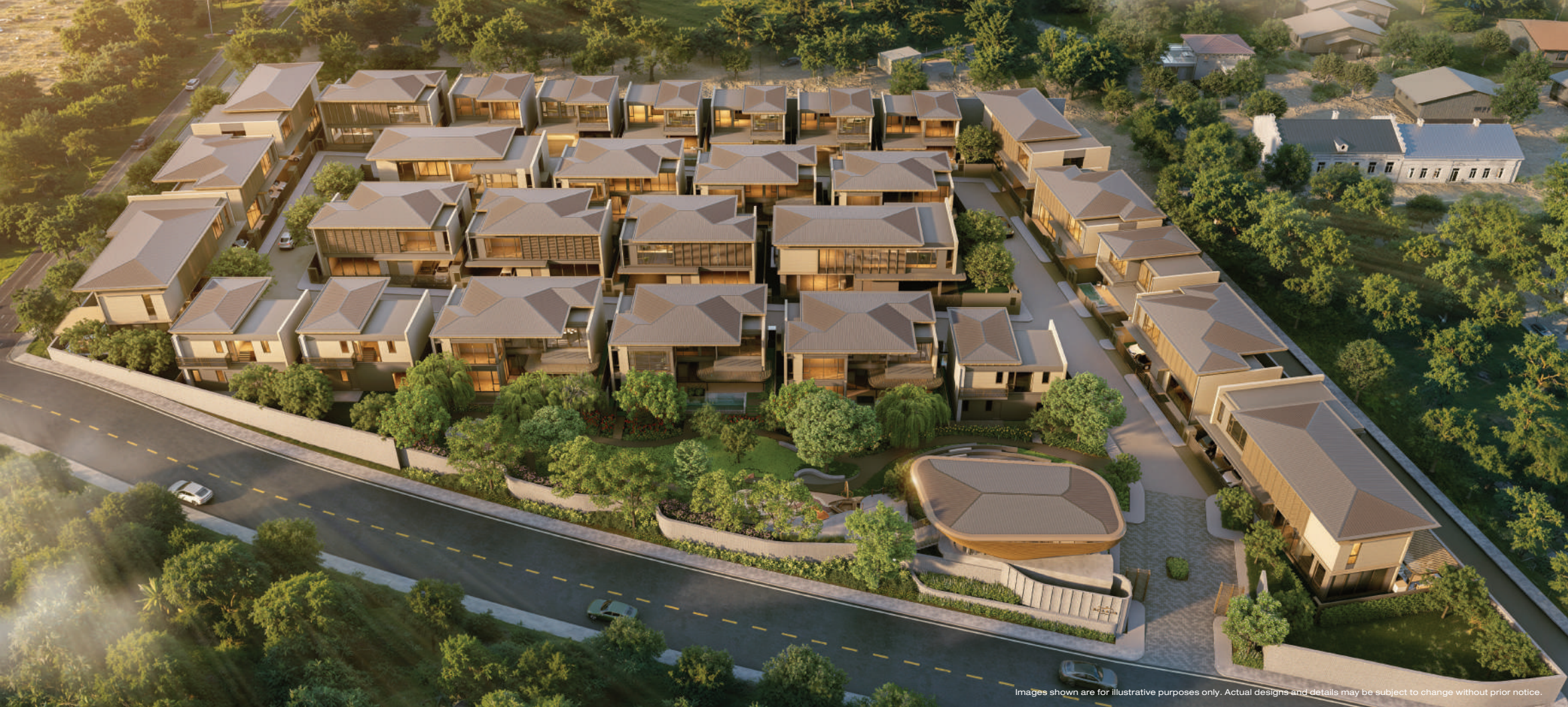
Images shown are for illustrative purposes only. Actual designs and details may be subject to change without prior notice.